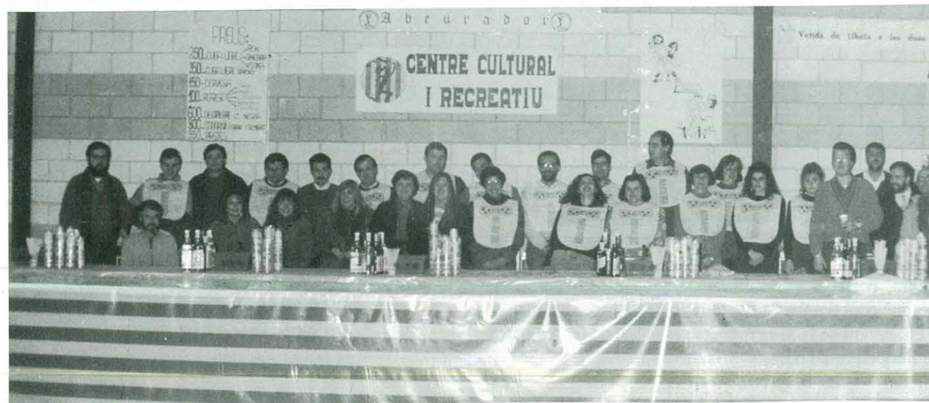
Pavelló Cobert 1.991.- Els "primers" Carnavals. Col·laboradors del C.C.R. a la barra. La gent comentava: Quina barra més grossa!... (referint-se al taulell, es clar!), mentre al carrer AIGUA, força aigua! Al·lucinant. En els "Cuba-libres" ni una gota. Paraula!... Els preus super-populars. Així ens ho van manifestar. Per evitar les bavejades, sort del pitet o "bavero".