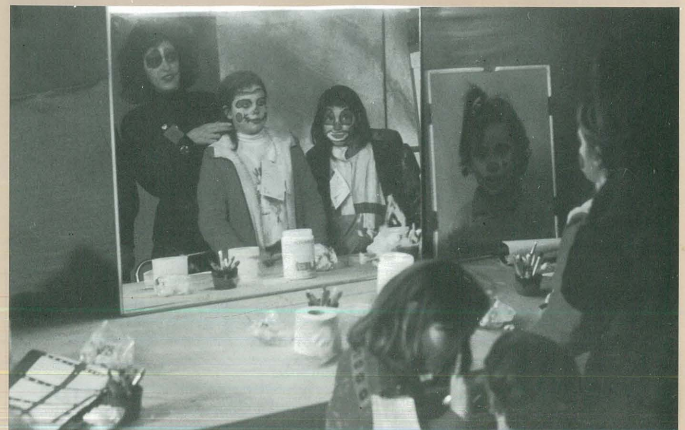
"PARC INFANTIL DE NADAL"