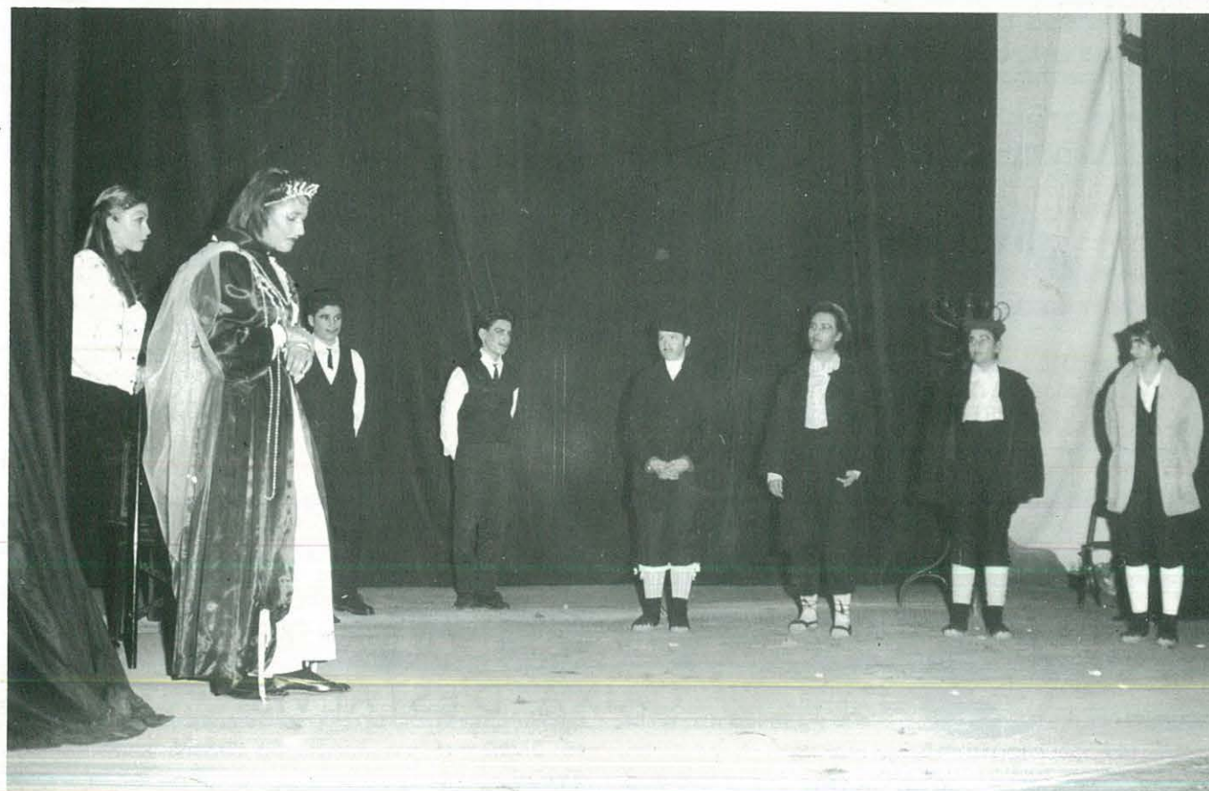
FESTIVAL DIA DE REIS