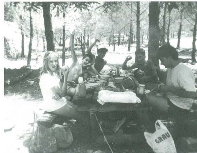
Una darrera sortida a La Tenalla

La propera sortida serà la de remontar el riu Sénia, sortint del camí de les caixetes fins al camí de l'Olivar, per pujar finalment fins al Castell.